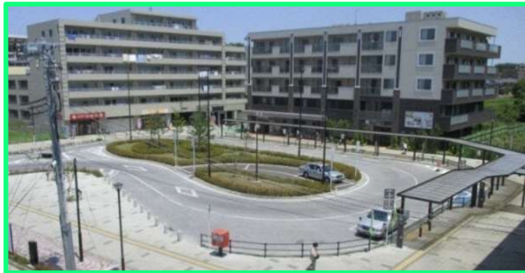
■飯山満駅前交通広場(平成 25 年4月竣工)