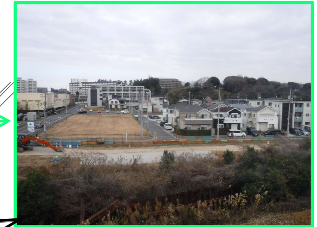
■飯山満駅北側(49街区周辺) 1号緑地