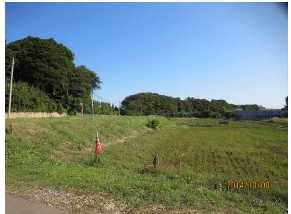
金杉3丁目の緑豊かな金杉緑地です。

貴重な緑を守り、調和のとれた街の景観を創り出すために、特定の地域を指定し、土地の利用を制限する制度で、都市計画の中で、建築物の高さや規模を抑えるなどの、規制をすることにより、緑あふれた秩序ある街並みを維持しようとするものです。